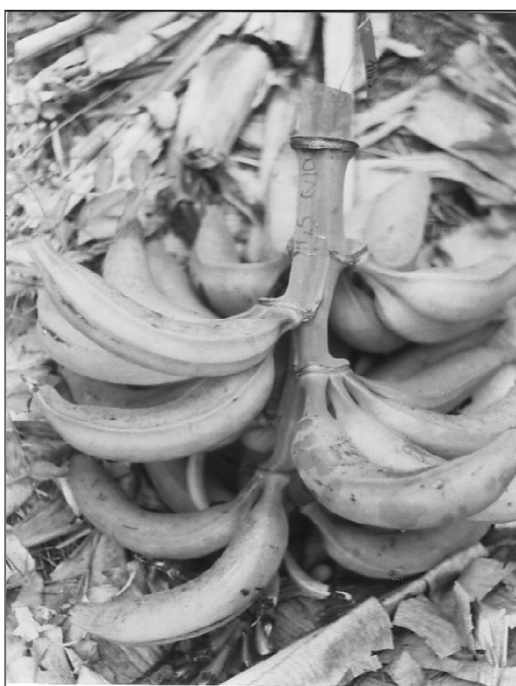
Figure 3. Régime de 18 kg de bananier plantain cv Corne 1, prétraité au 2,4-MPA