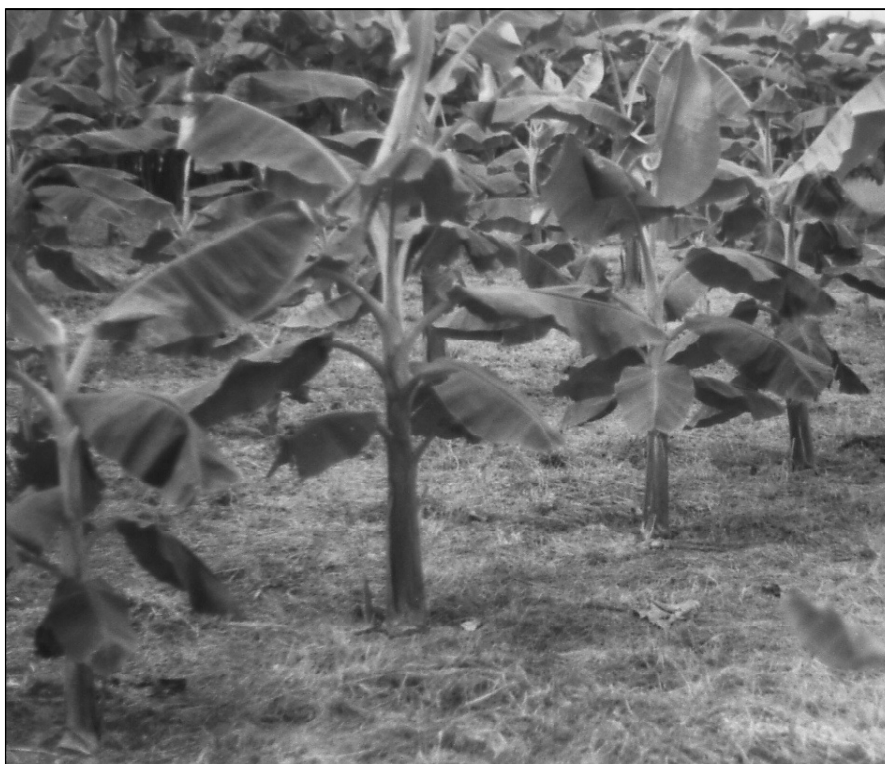
Figure 1. Bananiers plantain cv Corne 1 âgés de 2 mois issus de rejet-écailles de type b préalablement soumis ou non à l'action de l'APA ou ses dérivés 3,4-D ; 3,5-D et 2,4-MPA