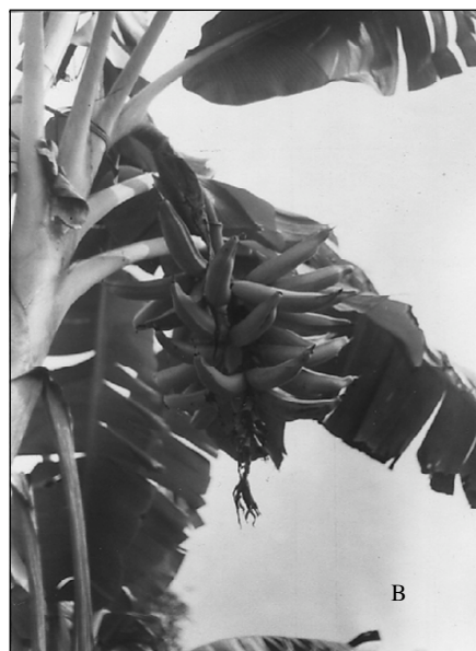
Figures 4 A - B. Régimes à maturité de bananiers plantain cv Corne 1, prétraités aux dérivés 3,4-D et 2,4-MPA

Photo A (gauche) : Régime rabougri obtenu sous traitement hormonal 3,4-D