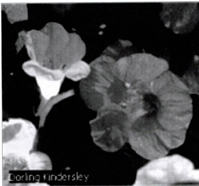
Figure 6 : Capucines

Les diverses couleurs et variétés composant un ensemble de capucines, dont la beauté homogène est remarquable, peuvent être, pour la ville de Libreville, un atout fort considérable sur les plans esthétique et artistique, parce que, finalement, un jardin cultivé avec soin se présente aux yeux de tout spectateur comme une œuvre d'art ; il serait comparable ici à une sorte de peinture inachevée suite aux modifications incessantes qui y sont portées. En effet, les fleurs doivent souvent être changées en fonction des saisons et des conditions climatiques, ce qui confère au jardin un statut d'œuvre à n-dimension, à cause du mouvement qui constitue une dimension supplémentaire. L'idéal serait finalement d'adapter l'environnement urbain de Libreville à ce mouvement ponctué de changements de couleurs florales et des lumières étincelantes, issues du panorama que peuvent créer de réels jardins publics au profit des populations locales, des visiteurs et des touristes en quête d'exotisme et de nouvelles découvertes.