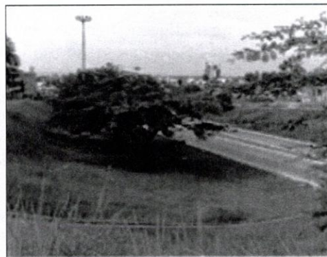
Figure 3 : L'espace vert de l'échangeur de la RTG décoré d'arbres sauvages.