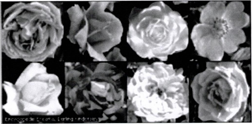
Figure 5 : Quelques variétés de roses (Des hybridations faites sur une centaine d'espèces ont plus de 20 000 variétés aux couleurs multiples).

La Capucine est une plante de zone tropicale, d'origine latino-américaine, que l'on retrouve aujourd'hui presque dans tous les continents grâce au système d'acclimatation et de l'évolution de la pratique des expérimentations horticoles. En effet, la question du climat ne se pose guère relativement à une éventuelle exploitation sur le sol de Libreville, en ce que la capucine est une plante de climat chaud et humide supportant beaucoup le soleil et la chaleur, des éléments indispensables à sa floraison et à son épanouissement. Afin de donner un ton coloré à l'environnement, elle est généralement cultivée en bordures de jardins, dans les massifs ; ses belles fleurs s'épanouissent très harmonieusement sous la chaleur et le jeu de reflets des rayons solaires. Dans les jardins publics, on trouve souvent des capucines avec de grandes feuilles très colorées munies d'un long éperon, habituellement rouge ou orange. Comme une bonne partie de plantes florales, les feuilles et les tiges de la capucine constituent un mets que nombre de citoyens consomment en salade. Selon les recettes, elles peuvent servir d'ingrédients aromatiques pour l'assaisonnement de certains plats, du fait de leur parfum doux et sauvage à la fois.