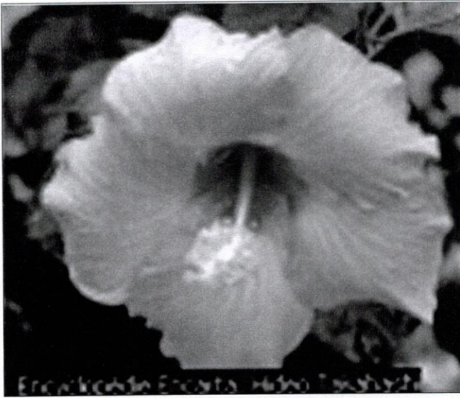
Figure 4 : Hibiscus jaune rosé venu d'Asie 11

De toutes les espèces florales, les rosiers constituent une espèce dont le charme profite à plusieurs grandes villes de la planète, Libreville peut effectivement en bénéficier, étant donné qu'en dehors de belles couleurs dont les fleurs disposent, elles dégagent en même temps un parfum très doux. La diversité des espèces horticoles étant immense, la rose est devenue la fleur du jardin public ou privé par excellence, et compte tenu de ses innombrables vertus, elle est aujourd'hui protégée en France. Scientifiquement, un rosier est un arbuste à caractère ornemental appartenant à la famille des rosacées ; il est très cultivé pour ses belles feuilles et son parfum, sans oublier ses vertus thérapeutiques ou médicinales. Les pétales souples de la plante sont de couleurs très variées et uniques à la fois : blanc, rose, rouge pour les roses sauvages.