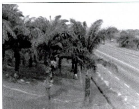
Figure 2 : L'espace vert de l'échangeur de la cité de la Démocratie décoré de palmiers à huile.