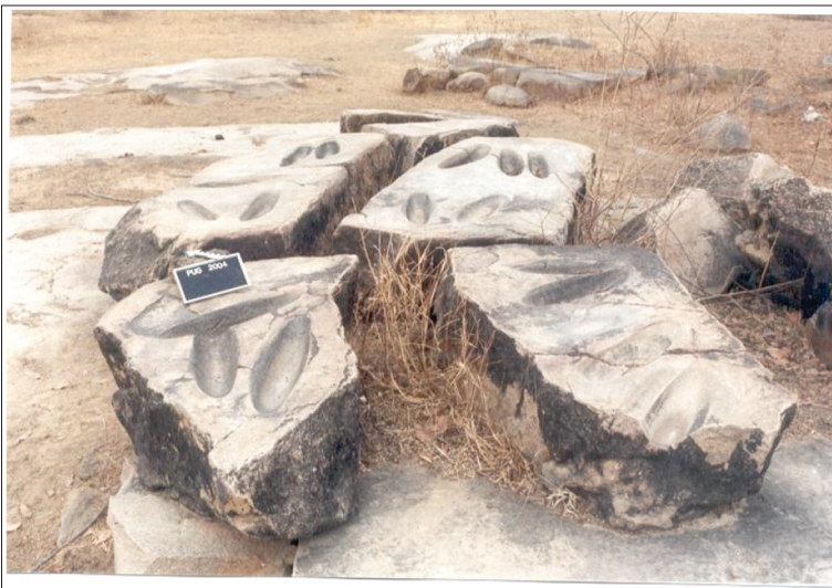
Photo 10. Des meules taillées dans des blocs de granite.

Même avec la présence des moulins modernes dans le village depuis 1985, les femmes continuent à moudre des produits à Bilg-pinga . Aucune femme n'est propriétaire d'une meule ou d'un mortier. Chacune travaille sur une meule non occupée au moment où elle arrive sur le site. Auparavant, elle identifie une série de meules compatibles avec les meulons qui eux, sont personnels et gardés à la maison.