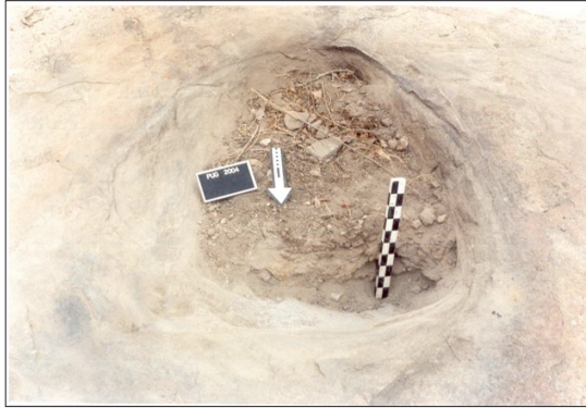
Photo 8. Le lieu où Bilgo aurait égorgé un bœuf pour remercier ces ancêtres de lui avoir permis de rattraper le Peul.

Vu de dessus, la structure a la forme d'un gros œuf mesurant 1,80 m de long et 1,40 de diamètre. Le trou était comblé au moment de notre passage par des sédiments, des cailloux, des tessons de céramique, des débris de végétaux. Nous avons dégagé la partie nord afin d'avoir une idée de la profondeur du trou. La hauteur de notre mire (50 cm) est inférieure à la profondeur de l'abattoir de 20 cm 40 .