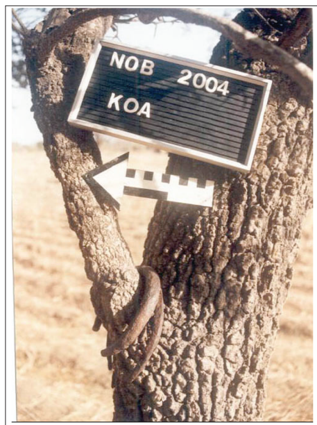
Photo 1. Bracelet de Bilgo à Koatenga

C'est au niveau de la forme et du poids que l'on observe les plus grandes différences entre les deux bracelets. Le bracelet B est en effet caréné avec toutefois des arrondissements au niveau des bords 27 .