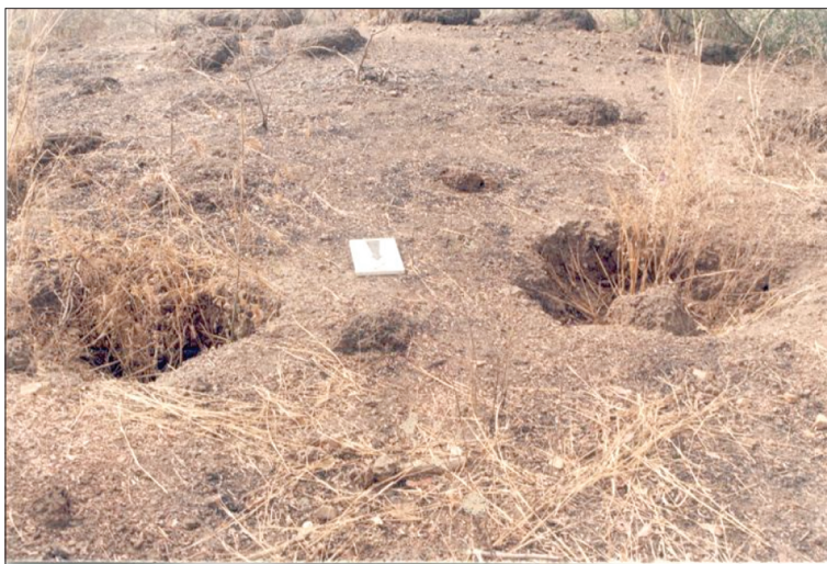
Photo 12. La mine de Nobili.

La mine de Pougneer Kougri porte le nom Kuigdg boko ; elle se trouve également sur une colline et avait été présentée comme des caches pour des gens que les grands-parents de nos informateurs n'ont pas vus. On devine trois puits comblés jusqu'à 0,50 m de l'ouverture et un grand trou duquel a poussé un Kānkalgā ( Afzelia africana ) sous la forme d'un kāngre (bosquet).