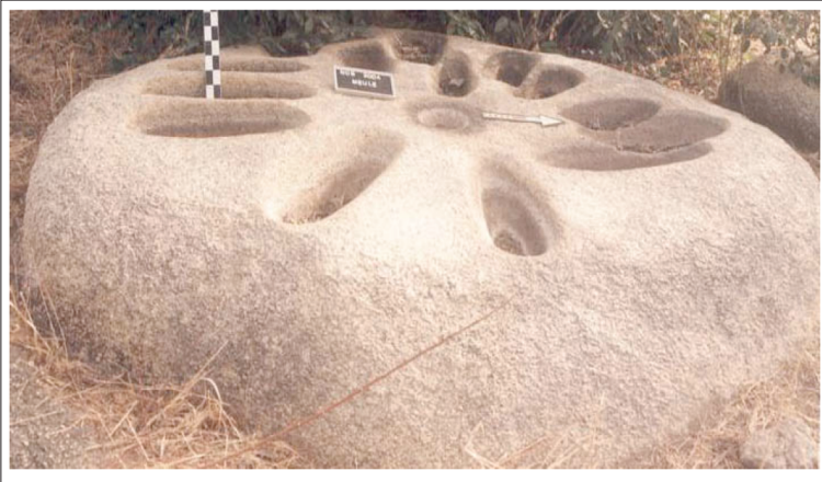
Photo 4. Meules et mortier (au centre) de Nobéré sur un bloc polis.

On dénombre plusieurs centaines de meules ou mortiers aménagés sur les blocs de granite à Nobéré. La longueur des meules varie de 30 à 55 cm pour 15 à 25 cm de profondeur. Ces meules sont des preuves d'une sédentarisation, d'une économie agricole et de l'existence d'outils métallique qui permettent de les tailler et de les polir pour certains.