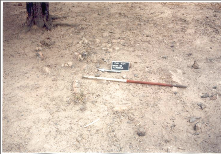
Photo 13. Vestiges de Nobili.

Les vestiges découverts à Nobéré et à Nobili sont ceux de boose .