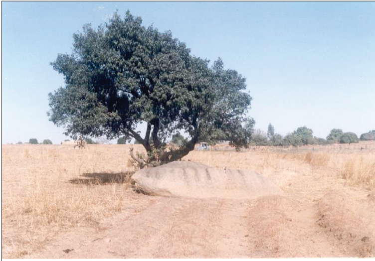
Photo 5. Atelier de tissage le bloc de granit ayant servi de lieu d'apprentissage du tissage aux enfants de naaba Bilgo

Il est horizontal et proviendrait du proche orient d'où il aurait été transmis par des sémites (non arabes) et des Peuls. S'il se trouve que le Moogo ne connaissait que le sundaogo de type soudanais, l'atelier de tissage de Bilgo devait comprendre alors un bâti 34 , partie fixe du métier auquel divers accessoires (les lisses, la poulie, les pédales, le peigne et l'ensouple d'enroulement) viennent se greffer. Le bâti tient sur un petit espace de 2,25 m 2 ; il est généralement aménagé sous un hangar ou à l'ombre d'un gros arbre, mais jamais dans un lieu construit. Le site est situé à une centaine de mètres du palais de Bilgo.