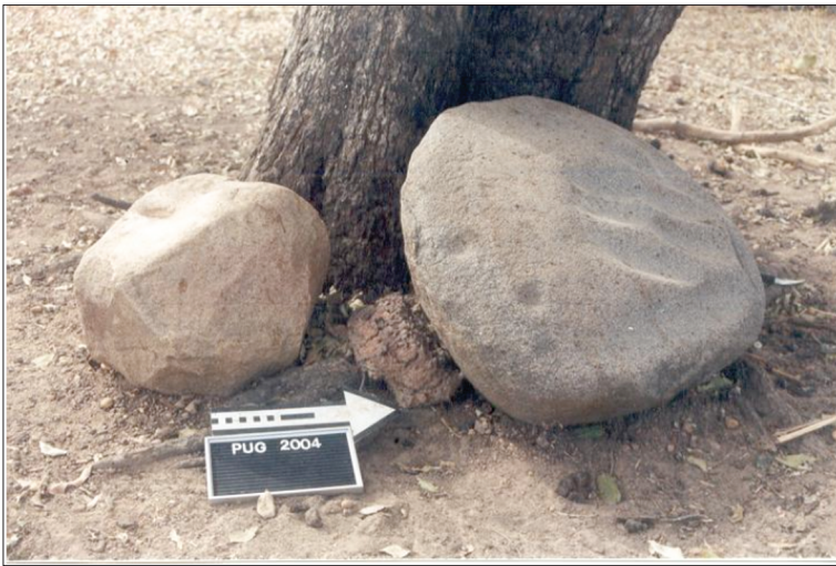
Photo 11. Les sièges éponymes de Pugneer Kugri .

La pierre qui fut le siège de la belle femme est en fait un bloc de granite de forme arrondie de 0,70 m de diamètre. Elle est adossée au tronc du Diospyros mespiliforma avec au-dessous un petit bloc de latérite. Sa surface présente 12 traces de polissage ressemblant à des meules.