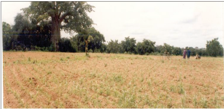
Photo 6. L'emplacement de l'ancien palais de naaba Bilgo à Koatenga avec au fond le baobab, tombé en 2003.

Des fouilles archéologiques effectuées sur trois endroits 35 du palais ont permis de recueillir de la cendre, des tessons de céramique, des objets métalliques, des ossements, du charbon de bois qui a permis grâce aux méthodes modernes de datations (carbone 14) de savoir que le site était habité depuis le XIII e siècle. Il y a eu plusieurs niveaux d'occupation respectivement au XIV e siècle, au XV e siècle et au XVI e siècle qui correspondent à la période de naaba Bilgo.