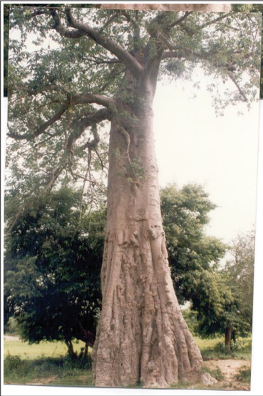
Photo 7. Le Baobab de Nobili « avec traces de sabots » du cheval de Bilgo.

Après l'accomplissement de ses vœux, Bilgo serait revenu non loin de l'endroit où ils avaient été formulés pour remercier ses ancêtres.