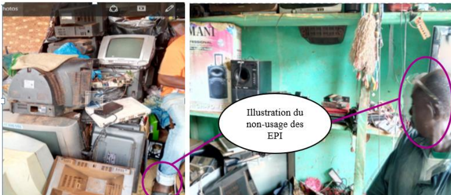
Photo n°3 : Illustration du non-usage des équipements de protection individuelle

(EPI) par les acteurs dans la gestion des D3E