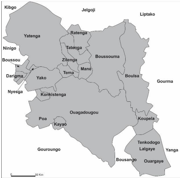
Carte 1: Pays moaaga à la date de la colonisation en 1895