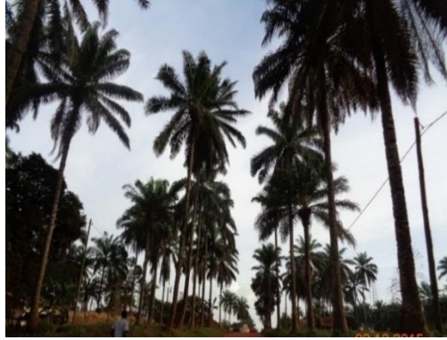
Fig.1 Route en terre Yaoundé-Lomié bordée de palmiers plantés par les Allemands. Lomié, 12 mars 2016.