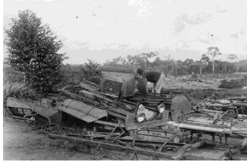
Fig.3 Matériel automobile retiré de la Lokoundjé.

Plusieurs fleuves à l’instar de la Lokoundjé regorgent des vestiges de la présence allemande jetés pendant les expéditions ou la Première Guerre Mondiale. Cette photographie illustre ceux récupérés par les Français après la guerre.