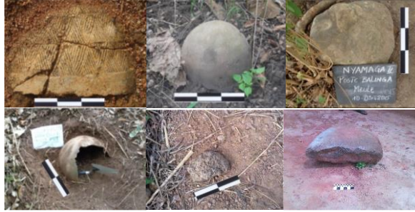
Fig.4 Culture matérielle provenant des sites d'occupations allemandes (Yoko, Nyamanga 2, Bafia, Ndikiniméki et villages abandonnés (Evindissi). Cliché Salamatou, mars 2016.

Les résultats d'inventaire et de fouilles ont permis de mettre en évidence une diversité des témoins de la présence Allemande mis en place entre 1884-1914 dans les régions du Centre, du Sud et de l'Est Cameroun. Il est établi que les éléments de la colonisation allemande sont, pour la plupart en ruine. La réflexion porte à présent sur la conservation/restauration de cet héritage colonial. Cela nécessite à l'amont une maîtrise des facteurs d'altérations.