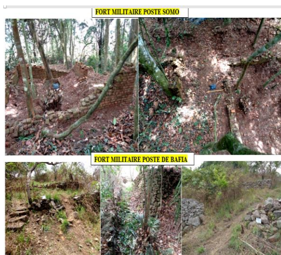
Fig. 3 Architecture militaire-fortification en brique de terre cuite (Ndikiniméki) et en maçonnerie de pierre sèche (Bafia). Cliché Salamatou, mars 2016.

Cette catégorie désigne les constructions dotées de systèmes de fortification destinée à la défense de vastes territoires, d'une ville ou d'un village : fort, rempart, tour, bastion, tranchée et palissade (cf. fig. 3). Ce type de construction caractérisait toutes les Stations militaires mises en place dans les régions de résistance des populations locales à la pénétration allemande.