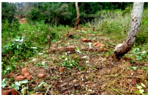
Fig.2 Cimetière européen en ruine, comportant plusieurs tombes qui dateraient de la Première Guerre mondiale. Cliché Salamatou, Lomié, 11 mars 2016.

Ce type renvoie aux cimetières européens composés de tombes allemandes et françaises.