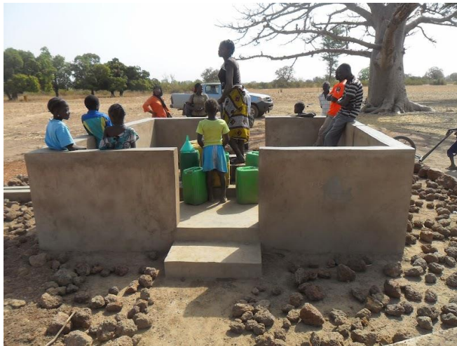
Figure n°3 : Forage aménagé par OCADES dans la Commune de Kayao