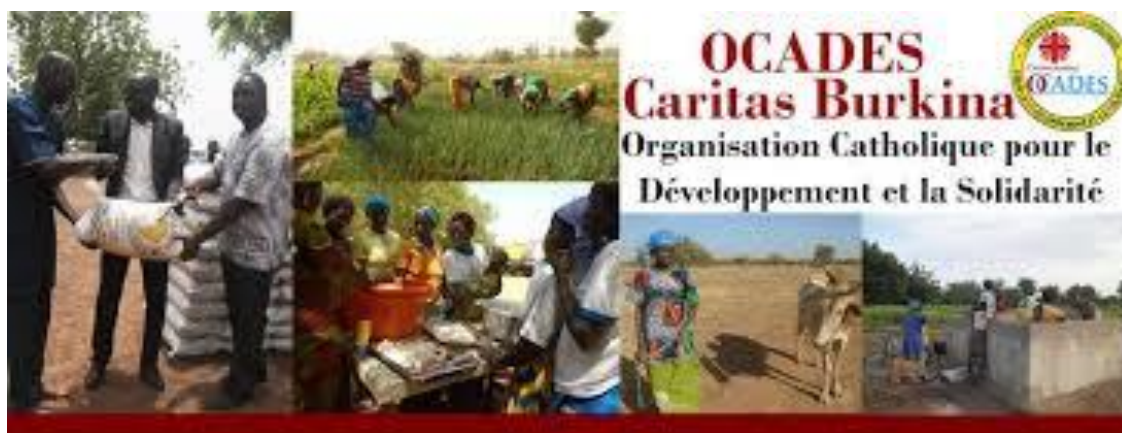
Figure 2 : OCADES – Caritas Burkina : secteurs d'intervention