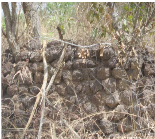
Photo 11. Ruines de Benkassa.