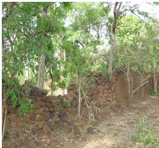
Photo 12. Ruines de Bini.