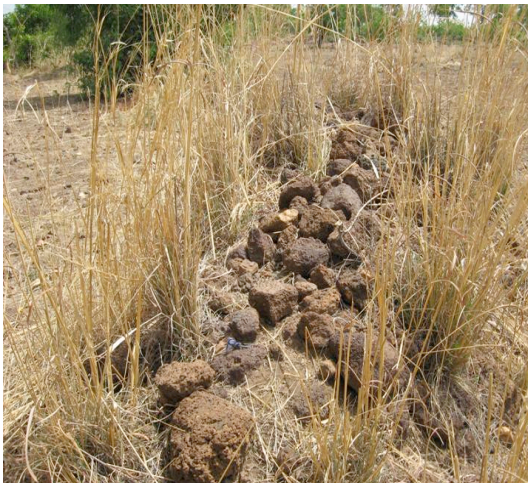
Photo 3. Ruines de Souroumbou .

Souroumbou est un village birifor situé au nord-est de Gaoua et à l'ouest de Malba dont il est plus proche (cf. carte). Ce village aurait été fondé par des Birifor, mais le chef de terre actuel admet que son ancêtre fondateur à son arrivée aurait trouvé en place des Touna qui se seraient déplacés suite à des conflits 11 . Des pierres alignées sont présentées comme les seules traces matérielles de l'occupation de la localité par les Touna. La concession du chef de terre est dans une enceinte de ruines de pierres (voir photo 2). Derrière les maisons se trouvent de grands cercles de pierres alignées à l'intérieur desquels on a des champs (voir photo 3). Pour le chef de terre, ces pierres sont les ruines des murs d'enceinte à l'intérieur desquels les Touna auraient construit leurs maisons d'habitation 12 .