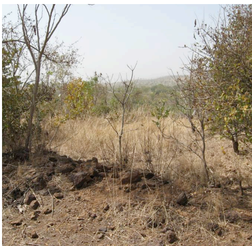
Photo 1. Ruines de Bakoulona.

Bakoulona est un village situé à une vingtaine de kilomètres au nord-est de Gaoua (cf. carte). Il aurait été fondé par des Touna qui en sont les chefs de terre même si dans le village on compte de nombreux Lobi. Ces Touna détiendraient des droits sur les terres de Gaoua dont ils seraient les propriétaires ; en cas de besoin ils sont sollicités pour des sacrifices à la terre 9 . L'occupation première de Gaoua par les Touna de Bakoulona et les sacrifices qu'ils continuent à faire à la terre de Gaoua sont confirmés par toutes les personnes auprès desquelles nous avons enquêté à Gaoua (cf. note 8). Dans ce village on note la présence de pierres alignées qui, selon les Touna, sont des restes de constructions en pierres 10 . Les Touna disent avoir occupé des terres vierges et se disent être à l'origine des constructions en pierres dont les ruines sont présentées ici (voir photo 1). Ces ruines qui sont en brousse s'apparentent à des cordons pierreux dont les pierres ont été déplacées. Elles ne seraient pas les seules du village car plus loin, il y en aurait de plus importantes.