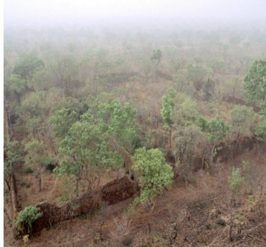
Photo 6. Vue aérienne prise du côté Est des ruines de Loropéni.