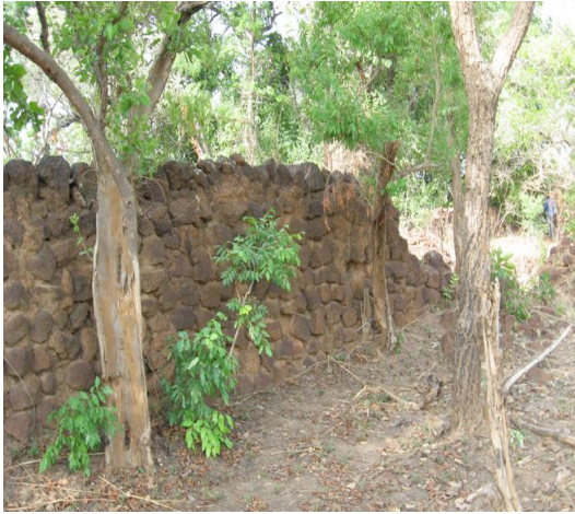
Photo 13. Ruines de Bini.

Bini est un village situé à plus de quarante kilomètres au nord-ouest de Loropéni. Fondé par des Dogosiè, une population apparentée aux Gan, Bini possède des ruines de constructions en pierres très importantes. Comme à Benkassa, les populations actuelles de Bini disent tout ignorer de ces ruines 22 . Il s'agit d'un grand mur d'enceinte assez bien conservé (voir photos 12 et 13). Mais à côté de ces ruines au mur moins détruit, existent d'autres dont la hauteur du mur donne moins de 50 cm (voir photo 14).