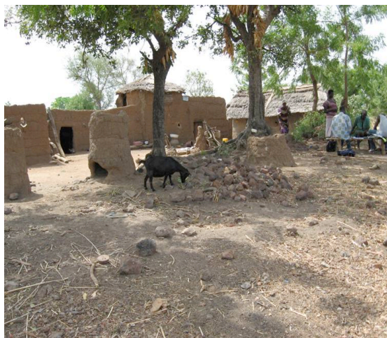
Photo 2. Ruines de Souroubou