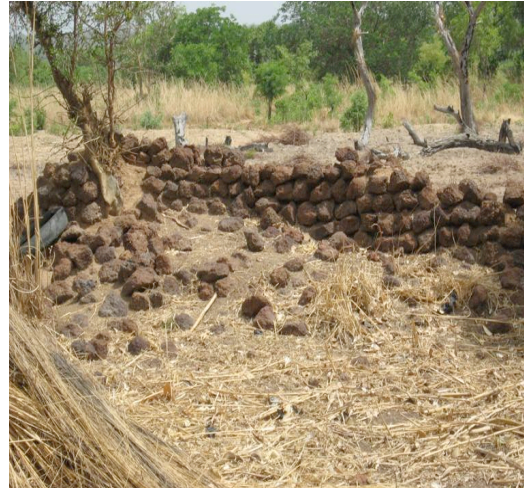
Photo 14. Ruines de Bini.